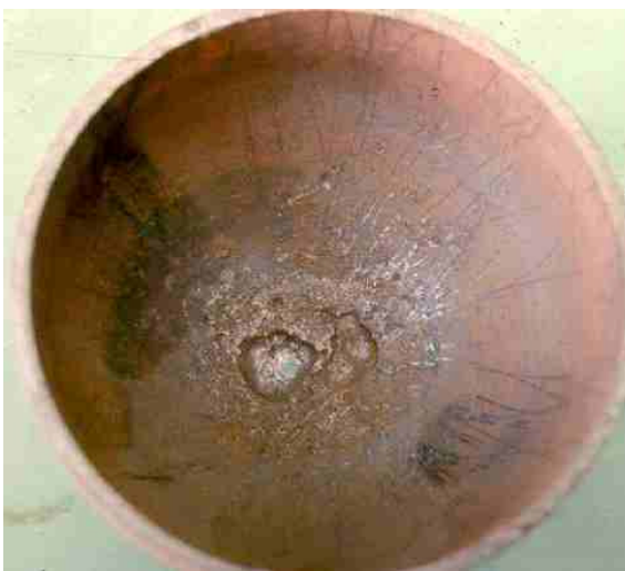
Corrosion dans le fond d'une bouteille de plongée.